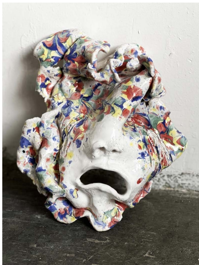
Les soupirs bleus, 31 x 24 x 10 cm, céramique émaillée, 2022 © Myriam Mechita

Les matins bleus firent apparaître les chiens de feu