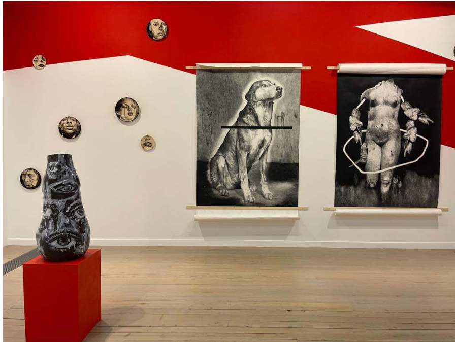
Vue de l'exposition « L'or de tes doigts m'a fait creuser jusqu'au bleu », Artothèque de Caen 2021

Cette proposition conçue par Myriam Mechita pour Art Now Projects fait suite aux deux installations récemment présentées à l'artothèque de Caen et à la Fondation Salomon. Elle en constitue à la fois un écho et un prolongement, alors même que la géographie mentale, sentimentale et expérimentale de l'artiste se déplace de ville en ville. Sorte d'antichambre sourde et silencieuse, les murs sont peints avec des éléments géométriques très graphiques.